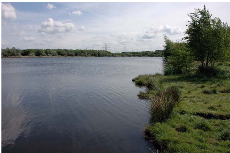
Blick von Einstieg „Auf dem Brooke“

Das ist zwar etwas länger zu laufen, hält sich aber auch noch in Grenzen. Eindeutiger Vorteil: mehr Parkplätze und es werden keine Anwohner gestört, es kann also auch keine Beschwerden geben.